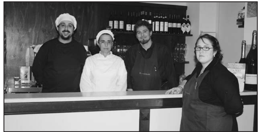
I gestori della "Mariconda".