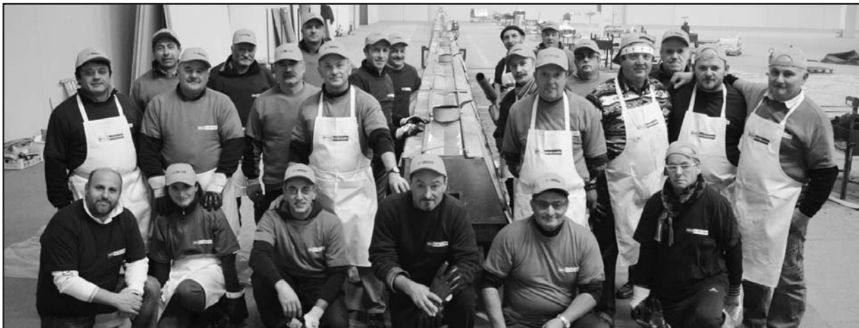
Il gruppo dello spiedo di Borgosotto.