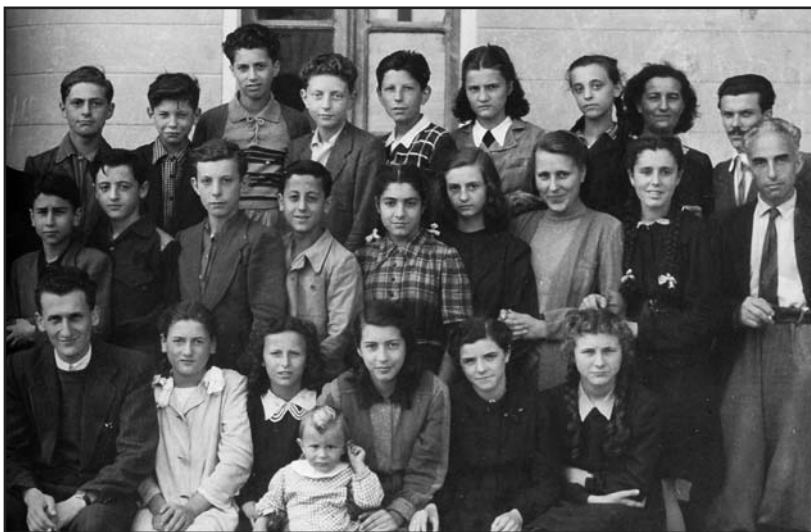
1947, Preside della Scuola Media di Montichiari.