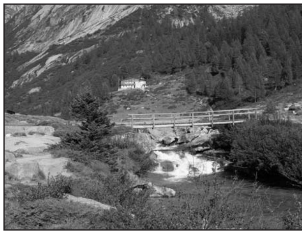
Val di Fumo, il rifugio e le prime acque del Chiese.

Venerdì 17 dicembre, ore 20,45, sala conferenze via xxv aprile 33: incontro mensile Amici del libro. Testo in conversazione CAINO di JOSÉ SARAGAMO, premio Nobel per la letteratura nel 1998.