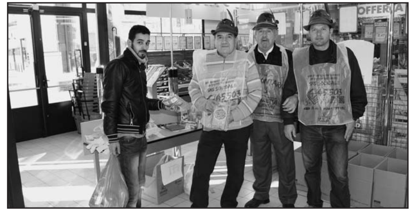
Un extracomunitario mentre consegna la sua offerta.