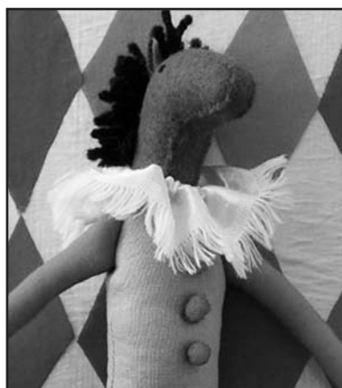
Una creazione dell'artista.

Si tratta di creazioni uniche, animali fantasiosi in feltro e materiali di recupero, dalle fattezze delicate, una sorta di muppets di francese eleganza. Infatti sangue di indole francese scorre nelle vene della giovane artista, che è nata a Morges, nella Svizzera francese nel 1981, anche se