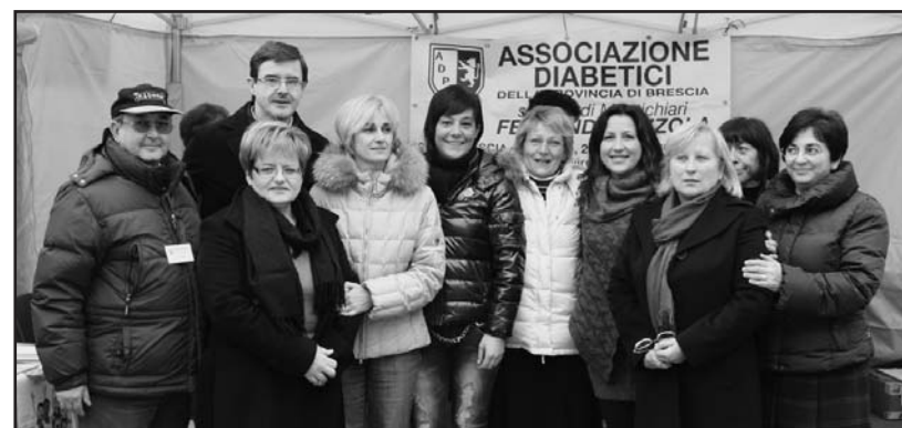
I volontari dell'associazione.

La prevenzione è la miglior cura di ogni malattia, e nella giornata mondiale del diabete la Sezione di Montichiari si è presentata in piazza S. Maria,